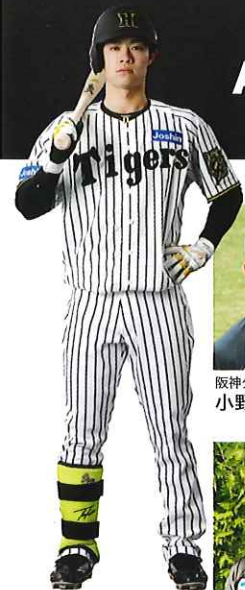
阪神タイガース 中野 拓夢