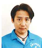
体操 五輪銀 池谷 幸雄