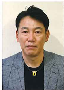
元プロ野球選手 井端 弘和