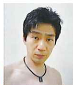
タレント 池谷 直樹