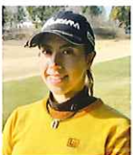
JLPGAプロゴルファー スタイヤノ 梨々葉